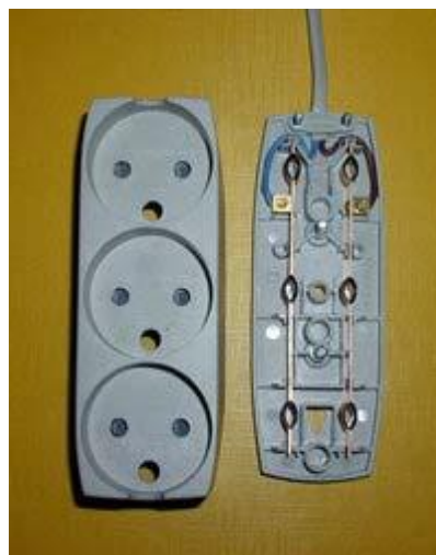
Fordelerdåse uden jord