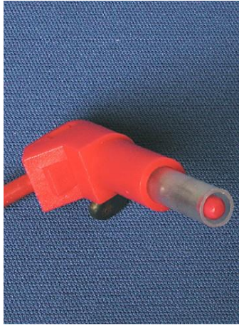
Stik med forskydelig kappe