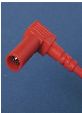
Stik med fast kappe

Sikkerhedsstik med fast kappe skal fortrinsvist benyttes. Disse stik kan kun isættes en tilsvarende sikkerhedsbøsning.