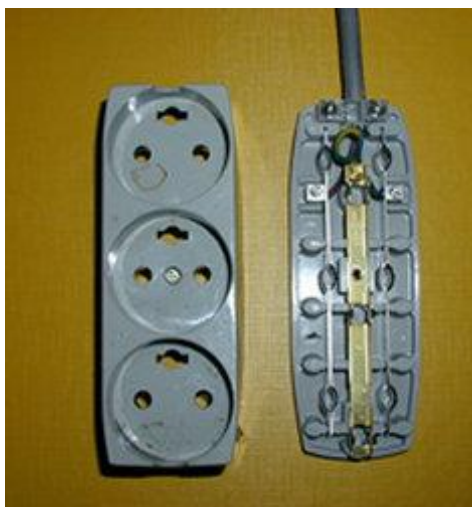
Fordelerdåse med jord

Fordelerdåser uden jordforbindelse, hvor stikpropper med jordforbindelse kan isættes, må ikke anvendes.